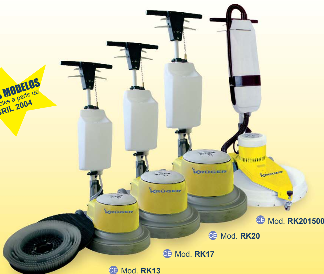
CE Mod. RK201500

NUEVOS MODELOS Disponibles a partir de ABRIL 2004